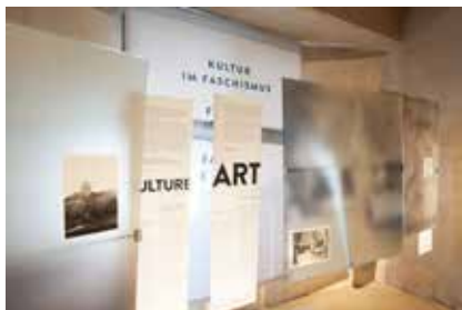
Particolare del perimetro esterno con il tema "Fascismo e cultura", sala 8 Teilansicht des „Inneren Rundgangs“ zum Thema „Kultur im Faschismus“, Raum 8