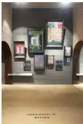
Particolare del perimetro interno, sala 8 Teilansicht des „Inneren Rundgangs“, Raum 8