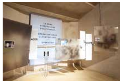
Particolare del perimetro esterno, sala 11 Teilansicht des „Äußeren Rundgangs“, Raum 11