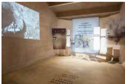
Particolare del perimetro esterno con il tema "Zona d'operazione delle prealpi", sala 11 Teilansicht des „Äußeren Rundgangs“ („Operationszone Alpenvorland“), Raum 11