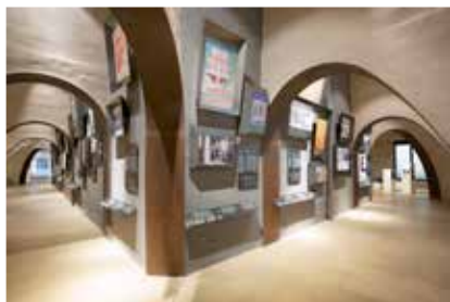
Veduta del perimetro interno del percorso espositivo Der „Innere Rundgang“ der Dokumentations-Ausstellung