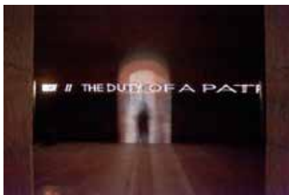
Proiezione della scritta al laser nella cripta Die Laser-Inschriften der Krypta