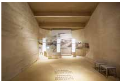
Particolare del perimetro esterno con il tema "Resistenza e democrazia", sala 12 Teilansicht des „Äußeren Rundgangs“ („Vom Widerstand zur Demokratie“), Raum 12