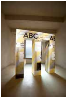
Veduta della seconda sala angolare "L'ABC del Monumento" Ansicht des zweiten Eckraumes („Das Denkmal-ABC“)