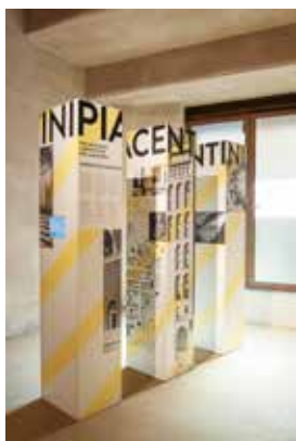
Veduta della terza sala angolare "Architetto Marcello Piacentini" Ansicht des dritten Eckraumes („Architekt Marcello Piacentini“)