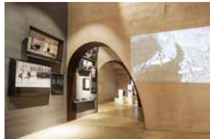
Particolare del perimetro interno, sala 11 Teilansicht des „Inneren Rundgangs“, Raum 11