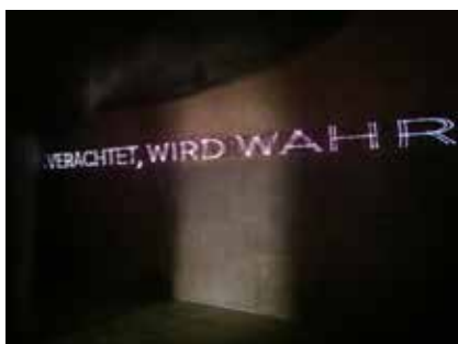
Proiezione della scritta al laser nella cripta Die Laser-Inschriften der Krypta