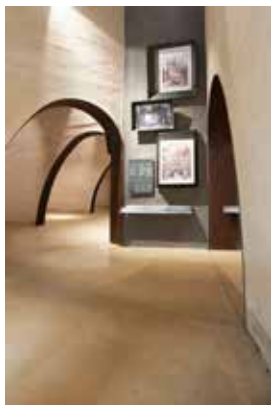
Veduta angolare del perimetro interno Teilansicht des „Inneren Rundgangs“