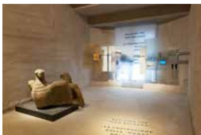
Sala 6, le aquile di Ponte Druso e in fondo parte del percorso espositivo con il tema "La costruzione della nuova Bolzano" Raum 6 mit den beiden Steinadlern der Drususbrücke. Im Hintergrund das Thema „Die Entstehung des Neuen Bozens“