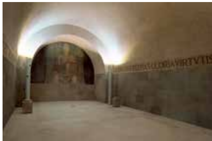
La cripta del Monumento Die Krypta des Denkmals