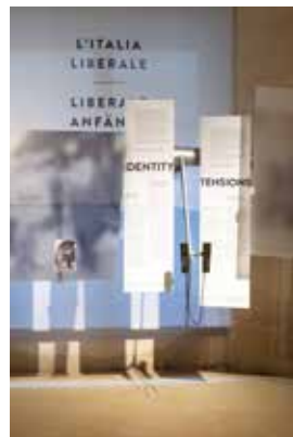
Particolare del perimetro esterno, sala 3 Teilansicht des „Äußeren Rundgangs“, Raum 3