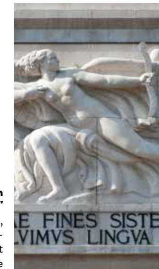
Figura de n'èila cun eles che tira na sèita, bas-relief dl artist Arturo Dazzi, sun l fruent a est dl Monumènt y pert dl'iscrizions per latin

L dom de Bulsan danejà dai bombardamènc dla Segonda viera mundiela, 1943/44